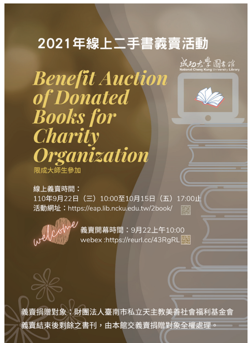
圖三 2021年線上二手書義賣活動海報