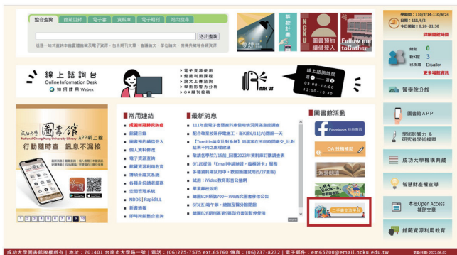
圖一 成大圖書館首頁連結二手書平台示意圖

經數次討論及評估後，決定將2021年二手書義賣活動改為線上舉行，並利用「二手書交流平台」做為平台，本館第一次線上二手書義賣於是誕生了。活動日期訂於2021年9月22日上午10:00至10月15日下午5:00，並於9月22日上午10:00舉辦線上開幕式；實際舉辦後又延長於10月16日至10月20日全面5折出清，再加碼五天活動（圖三）。