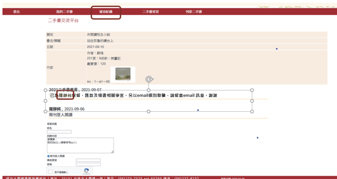
圖五 買家點選留言紀錄內容示意

買家如要確認是否成為買主，可隨時在平台的留言紀錄中進行查詢，同時本館也會於三個工作日內回覆是否已替買家成功保留圖書（圖五）。