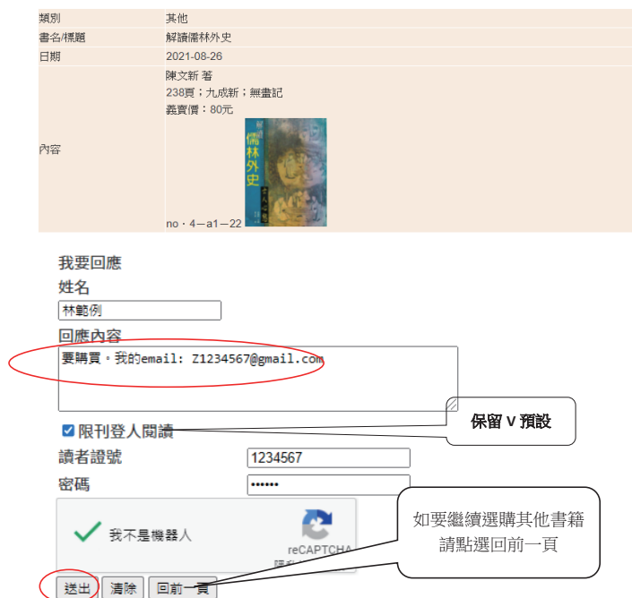
圖四 買家挑選想採購之圖書及下單步驟

買家在平台中挑選到喜歡的圖書後，於下方回應內容中留言「要購買」及常用Email後按「送出」（圖四），即完成選購動作；完成選購程序後系統自動發送Email，但不等於已得標（本館會以收到訊息之先後，決定保留給第一位買家），需於三個工作天後回到二手書平台查詢，或點選Email中的書名確認是否成為得標者。