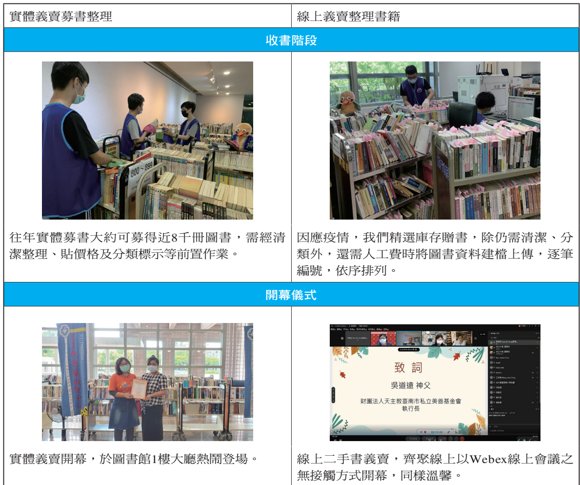
表一 實體與線上二手書義賣比較表

實體義賣與線上義賣在許多環節與流程上不盡相同，以下分別從收書階段、開幕儀式、交易方式、付款取書等方面進行比較（表一）。