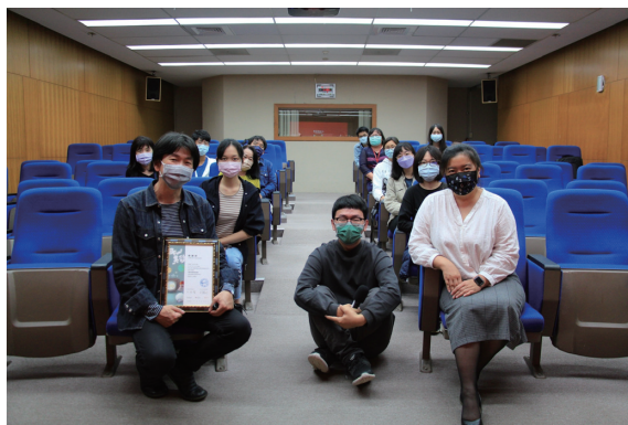
圖十二 小貓巴克里的奇幻旅程映後座談——與導演合影。