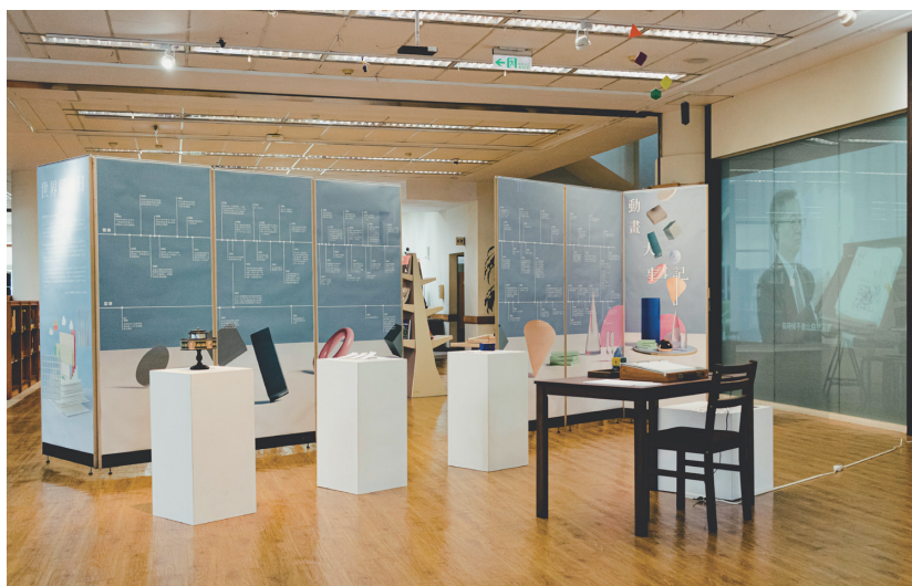
圖七 世界閱讀日主題書展：動畫工藝主題書展——動畫大事記展場紀實。

代理商一度不願意再進口該項商品，幾經溝通後才終於答應下訂，耗費兩個月時間從西班牙進口再交貨到本館，有驚無險地趕在開展前一週到貨，但該道具卻成為展場中互動率最高且最受好評的展品。