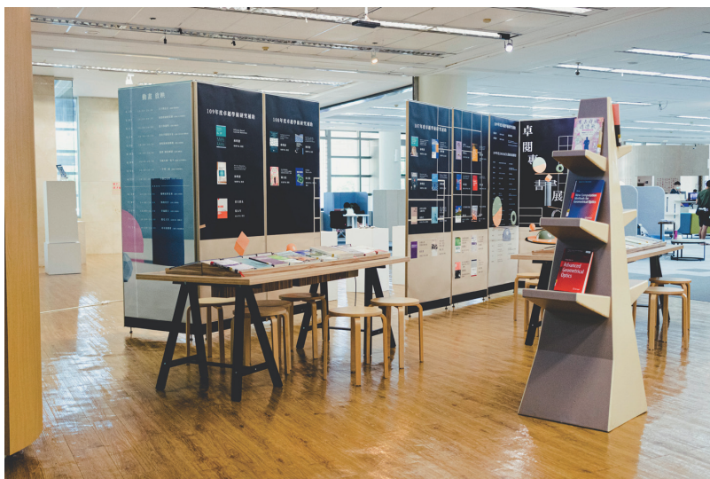
圖二 卓閱專書暨教師出版圖書展——展場專區紀實。

開展前，圖書館特別為獲得補助作者錄製導讀短片，使具有深度的學術專書內容與概念得以活潑呈現；而實體展區則透過雙面展板印製大面積的繽紛3D視覺，藉以介紹獲補助的書封與作者簡要資訊（圖二）。除此之外，教師出版圖書展的書單，則是集結2020年本校教師出版的作品而成，包括多種跨領域學術研究著作相互映襯。展覽期間更透過玻璃螢幕放送導讀短片，使展場更顯流光溢彩（圖三至圖五），除深化學術著作的質感形象外，也讓獲補助教師有尊榮、禮遇之感。