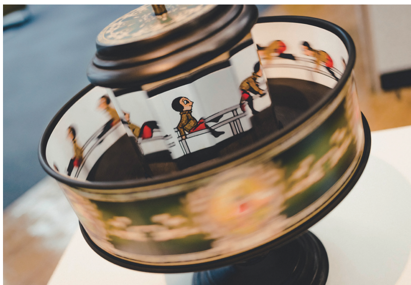
圖八 鏡射式動畫幻影箱。