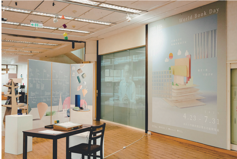
圖五 世界閱讀日主題書展：主視覺牆與玻璃螢幕——展場紀實。

導讀影片邀請到鉉琠工作室協助拍攝、剪輯與後製，開拍前先擬定大致訪綱，拍攝地點則選為圖書館四樓別具特色的「德國書房」 4 作為背景，讓獲補助的學術著作在具質感的空間裡襯托出低調沉穩的氣息；而兩位老師也在拍攝的過程中口述了書寫過程與書籍的架構等，使讀者可以從目錄中就能快速了解章節的發展與後續應用的索引。