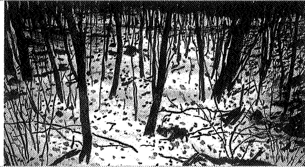
王維潔 冬之蕪 水彩畫 Wang Weichieh, Winterreise, watercolor, 1990