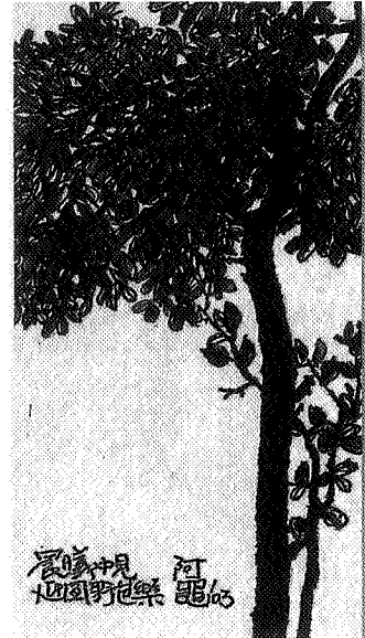
王維潔 微風 水彩畫 Wang Weichieh, Breeze, watercolor, 2003