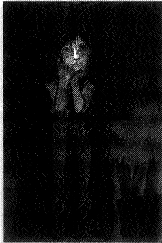
王維潔 安平 水彩畫 Wang Weichieh, Anpin, watercolor, 2001