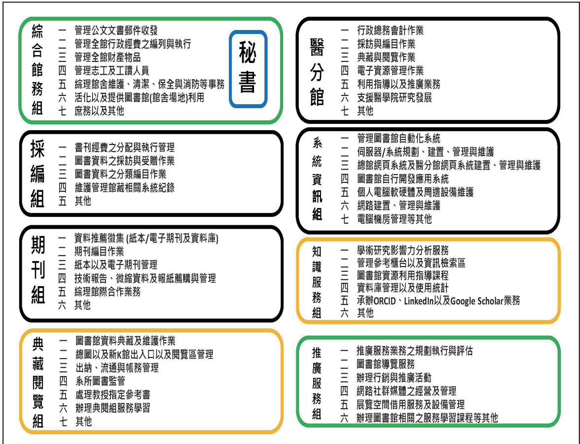
圖二 組織改造後之二級單位業務職掌

館方於109年推動組織改造方案之際，即達成共識，預計於111年審視二年來組織改造的成效，進一步檢討組織架構與進行館方例行之組長輪調，為圖書館中長程未來擘劃合宜的組織配置方針。