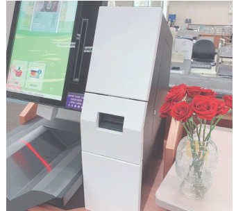
圖七 自助借書贈玫瑰花