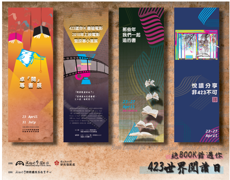
圖一 絕BOOK錯過你：4/23世界閱讀日系列活動海報

4月23日是文豪莎士比亞及多位偉大作家辭世的日子，為紀念並推廣閱讀和寫作，聯合國教科文組織（UNESCO）於1995年將該日定為「世界閱讀日」（World Book Day），希望人們享受閱讀書本的樂趣，同時促進出版及對著作版權的重視。成大圖書館為響應此全球性之閱讀盛事，自108年4月23日起至7月31日舉辦一系列閱讀活動，包含：「卓『閱』專書展」、「423邀你K書嗑電影・2018年上映電影暨原著小說展」、「那些年，我們一起追的書・精選書展」及「Facebook悅讀分享・非423不可」共4項活動。