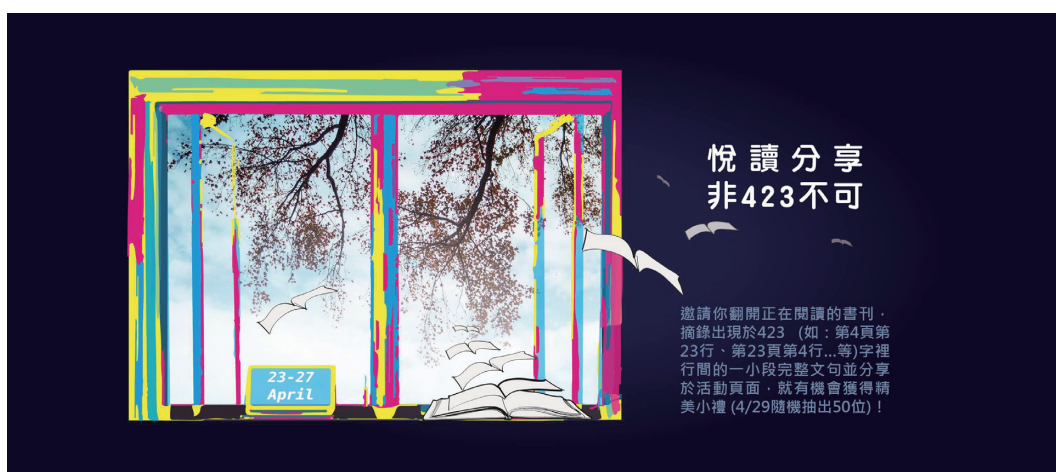
圖八 「Facebook悅讀分享·非423不可」海報

「準備表演的過程，一次又一次和與自己立場相反的人交流溝通，有些觀點即便不能完全感同身受，但中有一份理解在無數次對話中流洩出來；我想，或許就是這齣劇所要傳達出的核心意義吧。」