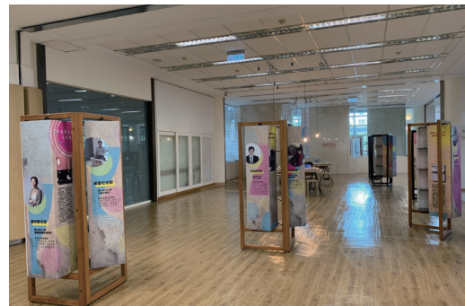
圖二 卓「閱」專書展展場配置