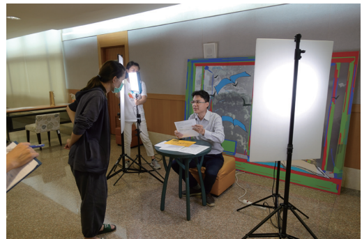
圖三 卓「閱」專書展拍攝過程