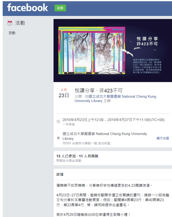
圖九 「Facebook悅讀分享·非423不可」活動頁面