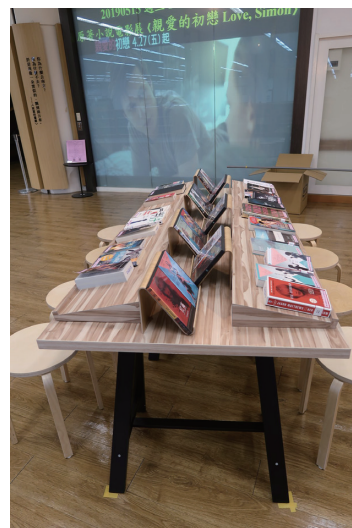
圖四 2018年上映電影暨原著小說展