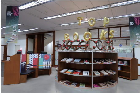
圖五 那些年，我們一起追的書·精選書展展場

並將龍血化成的鮮紅玫瑰送給公主，因而獲得公主回贈之象徵知識與力量的書籍。為讓讀者感受這樣一個浪漫又知性的節日，圖書館準備了玫瑰花送給浪漫的愛書人，書展期間利用自助借書機借閱書籍，就可憑當日自助借書機收據及借書證件兌換玫瑰花1朵，每日限量10份，每人每日限領1份，共計有50名愛書人帶回浪漫的書香禮物。