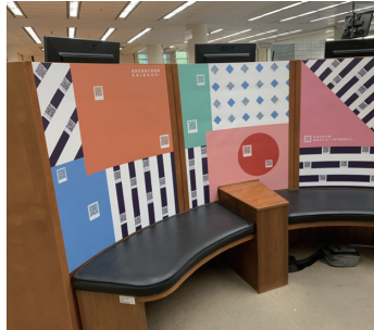
圖六 精選書展電子書海報