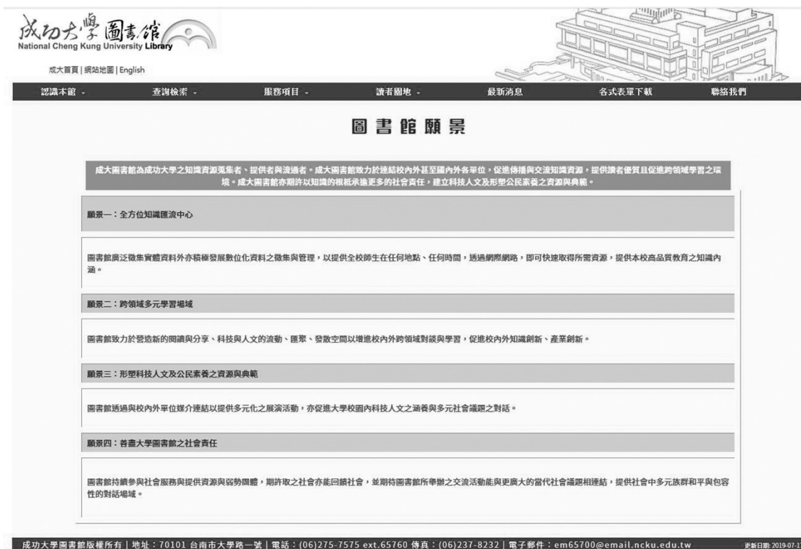
圖一 成大圖書館的願景

達而成為發散且跳躍式的概要累積等現況；更讓我們重新思考——我們該如何將這成大圖書館的四大願景化為行動來實踐呢？