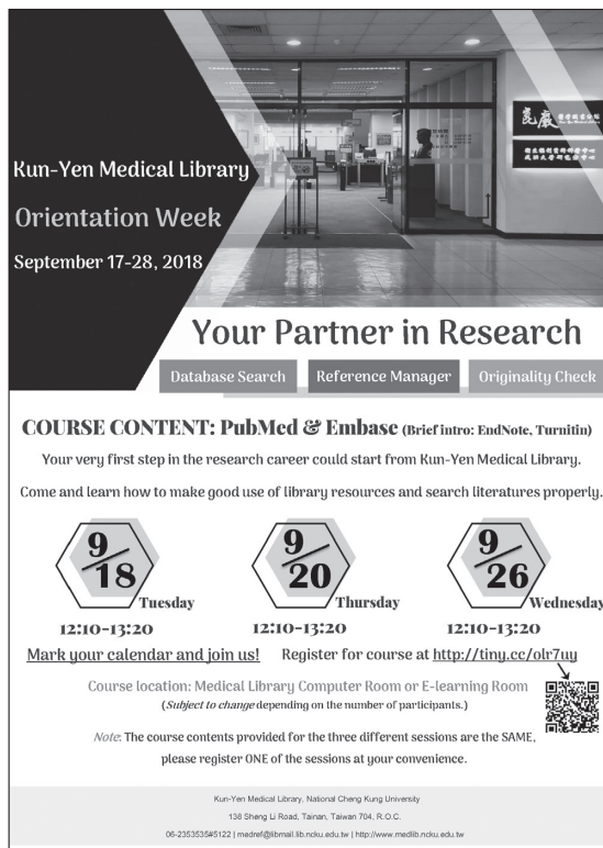
圖二 107學年度醫分館外籍新生導覽課程活動海報

對於首次開設醫分館外籍新生導覽課程，參考服務同仁們不僅勇於面對新挑戰，更願意提供過去的工作經驗建議課程內容與走向，多方考量外籍新生剛入學可