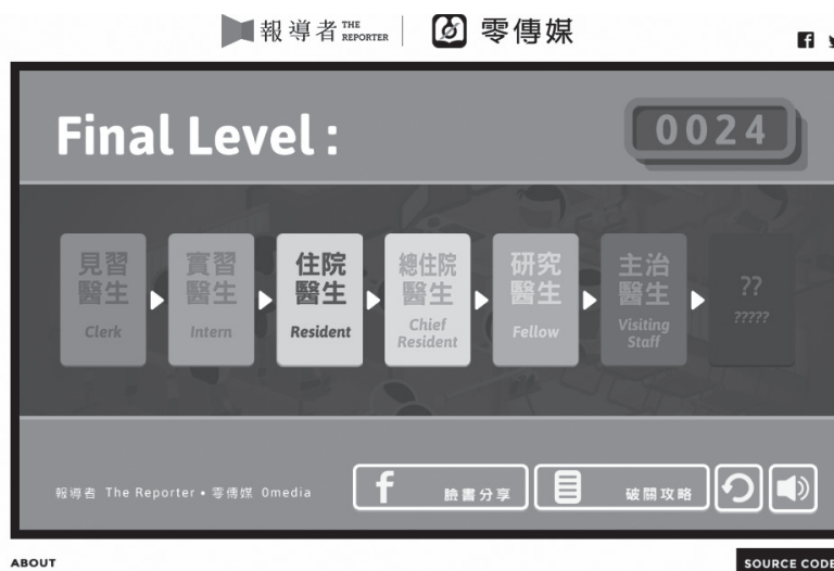
圖四 〈急診人生〉新聞遊戲結果以醫師等級呈現，拯救病患愈多，愈向右側主治醫生邁進

遊戲根基於與數位急診專科醫師的訪問，企圖呈現最真實的急診室醫療情況。遊戲背景鎖定在臺灣的一間大型醫學中心，參與者必須擔任鍵盤醫師，依病患症狀輕重