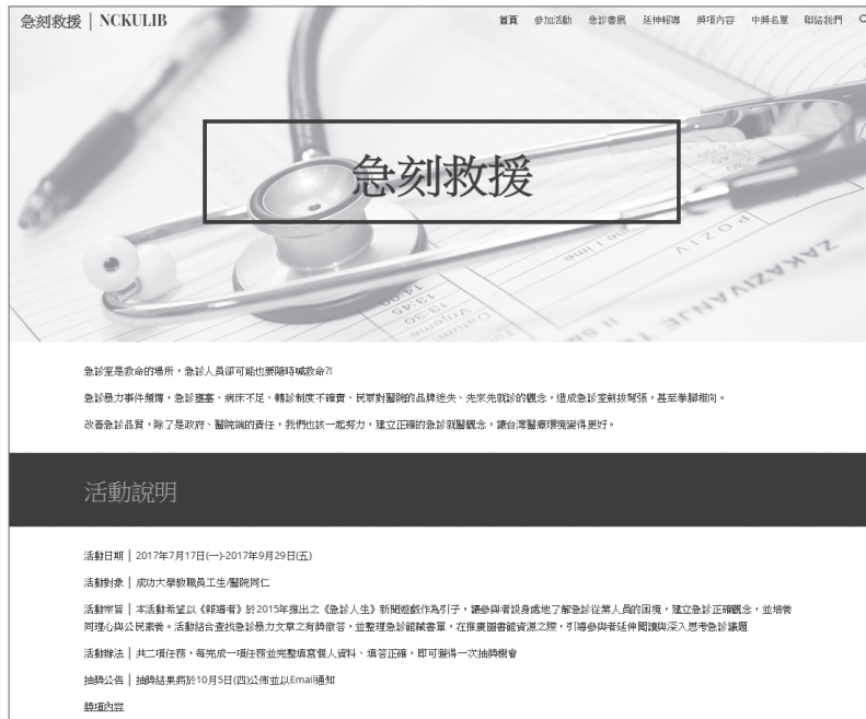
圖一 急刻救援活動專屬網頁 ( https://sites.google.com/view/nckulib-edlife )