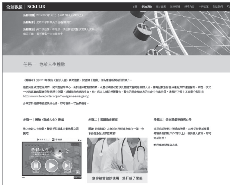
圖二 急診人生體驗任務內容，分別為體驗〈急診人生〉遊戲、閱讀指定報導與分享遊戲等級與心得。