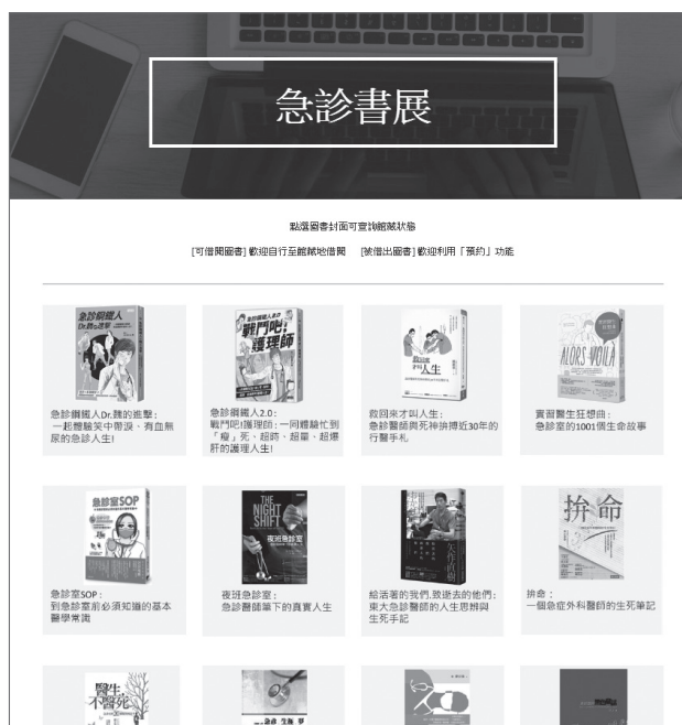
圖五 急診書展網頁