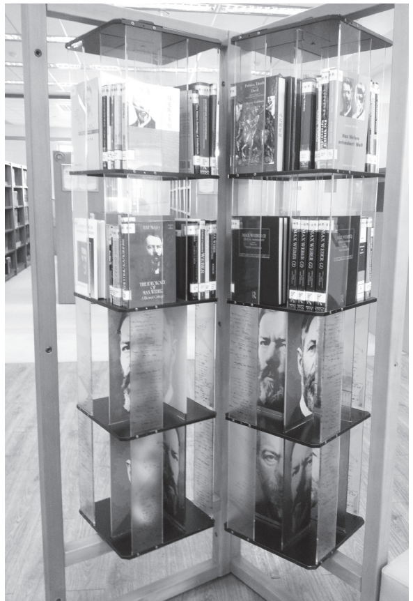
圖十五 整體展場設計