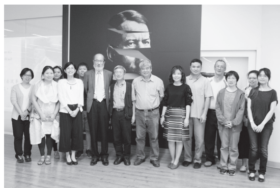
圖四 開幕式來賓合影