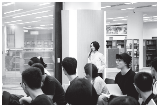
圖八 現場聽眾提問