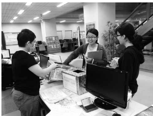
圖六 集滿四點即可現場抽小禮物