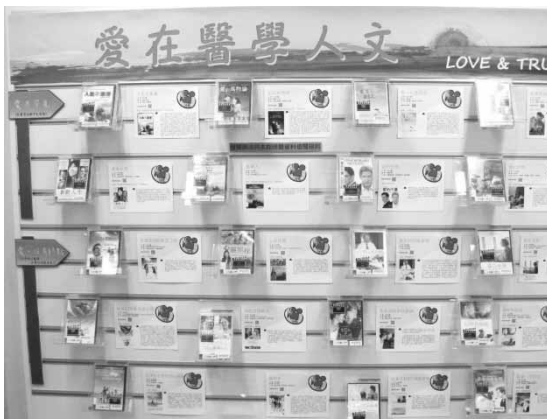
圖二 愛在醫學人文影展

先前有和摯友討論關於「決定自己的生死」這件事，今天如果我是臨終病人，身上插滿管子，無法說話，那我是否有權利決定自己的生死？這週末回外公外婆家時，我覺得可以向他們分享這件事，趁他們還健康時詢問他們的想法，也可以先與父母分享。