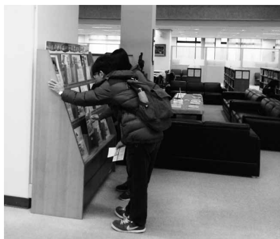
圖五 生命練習題文章引人入勝