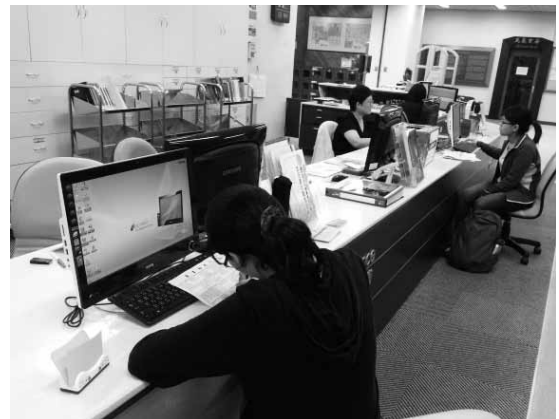
圖三 參與者認真回答BINGO連線題目