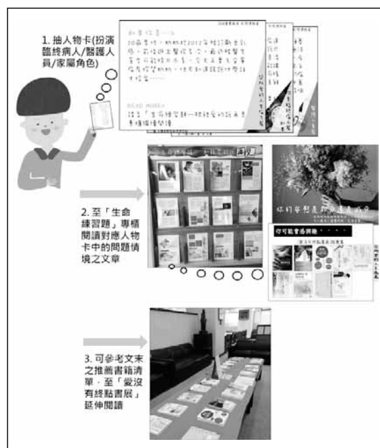
圖一 人物卡運用說明

「愛沒有終點書展」共展示22冊書籍，展示地點為休閒期刊區的沙發區長桌，考量此地點為讀者課餘或休息時間的熱門駐足地點，因此將書籍展示於此區，藉由主題展使原分散於醫學人文區、中文圖書區的書籍產生關聯，結合地點與主題性兩項因素，活動期間因此吸引許多讀者順手翻閱（圖一）。