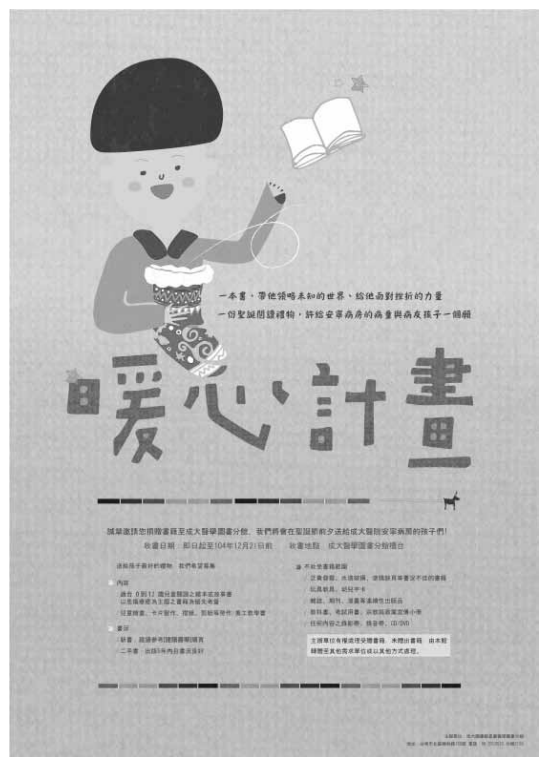
圖九 暖心計畫海報