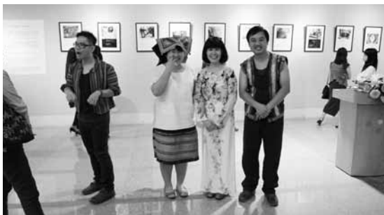
圖四 真人圖書著傳統服飾合影