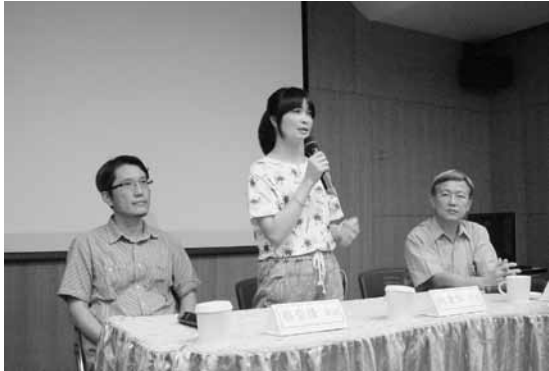
圖十二 主題影展與映後座談《失婚記》

頭說出他們內心的故事，觀看者能更進一步認識這些離鄉背景、與我們生活在同一塊土地的朋友們（圖十二～圖十三）。