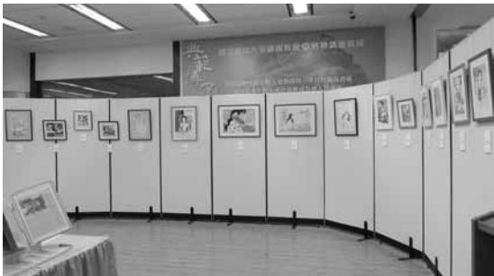
圖九 主題圖書、東南亞語文報刊及畫作展（二）