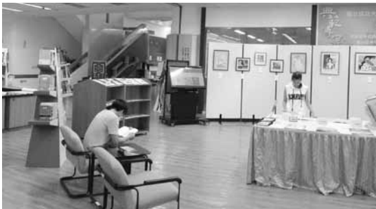
圖八 主題圖書、東南亞語文報刊及畫作展（一）

除了文字資料外，現場也展出《四方報》精選的多幅東南亞移民工繪製之藝術畫作，展現出他們的另一種才華（圖八～圖九）。