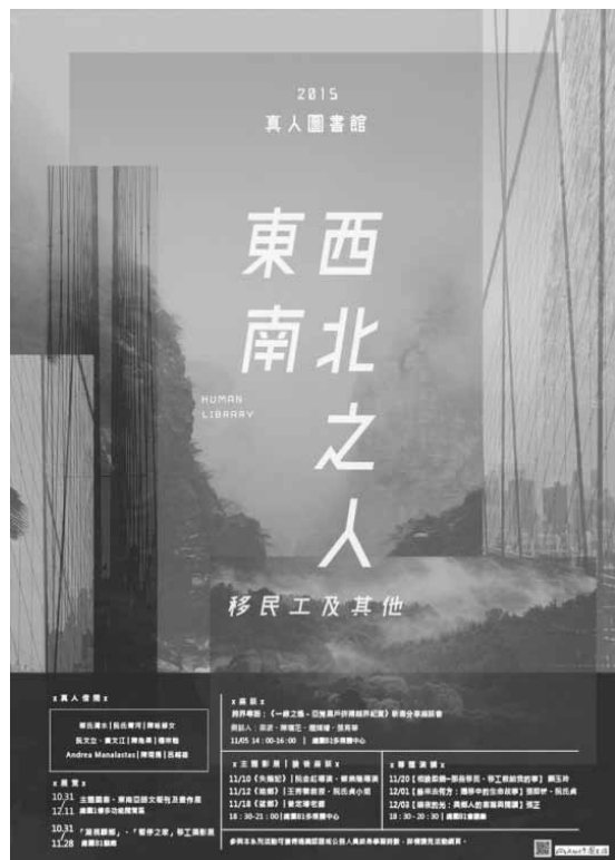
圖一 真人圖書館系列活動主海報

從移工朋友和臺灣本地人不同的觀點出發，展出作品分成兩部分：「凝視驛鄉」和「暫停之家」。「凝視驛鄉」是由