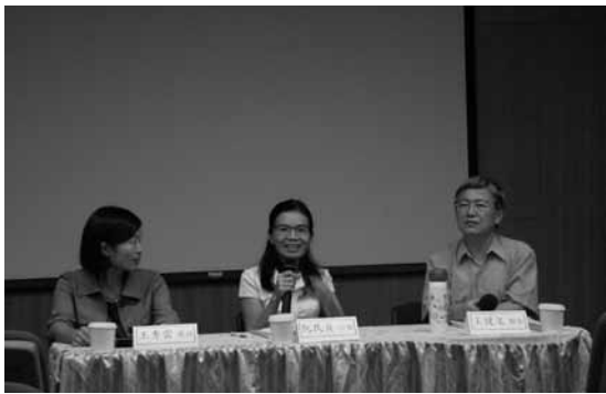
圖十三 主題影展與映後座談《追鄉》