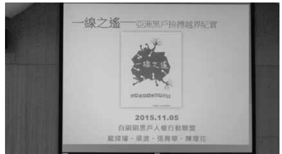
圖十 新書分享座談會（一）

所迴避的焦慮與恐懼，將其結塊硬化的土壤鬆開，讓埋藏其中的陰暗得以面見陽光，藉此得以反身，面對壓迫歧視的結構；有別於主流社工的工作者、與黑戶共同經驗著明暗浮沉的生命歷程（圖十～圖十一）。