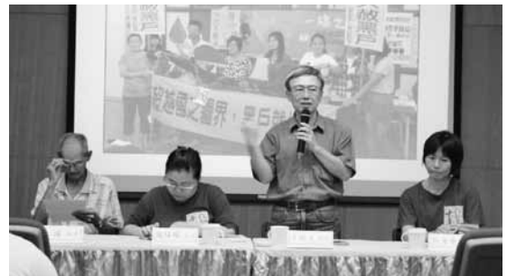
圖十一 新書分享座談會（二）