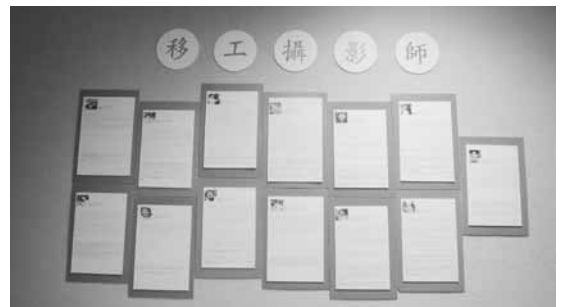
圖七 移工攝影展（二）