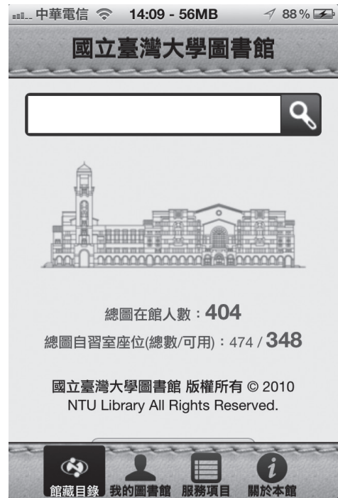
圖二 臺大圖書館行動版網頁

讀者可查詢圖書館館藏目錄是否有某本需要的書，輸入個人帳號及密碼即可預約或就已借閱之項目線上續借（如圖三）；同時亦可連結臺大書卷講，此為圖