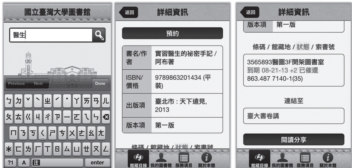
圖三 行動版網頁的館藏查詢、預約和連結