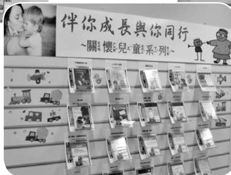
主題影音·精彩100 「伴你成長與你同行」