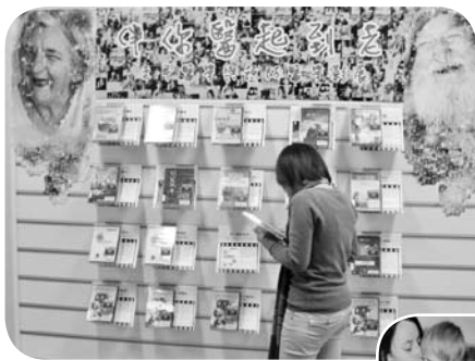
主題影音·精彩100 「伴你醫起到老」