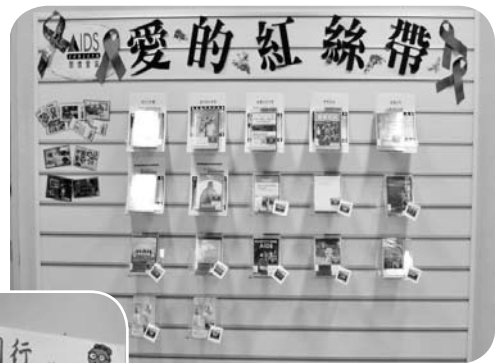
主題影音·精彩100 「愛的紅絲帶」