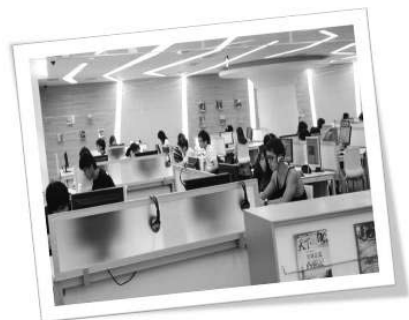
圖十二 數位學習區