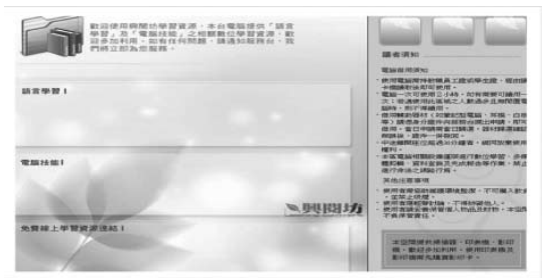
圖十一 各區專屬電腦桌面

數位學習區（圖十二）是可以自我學習的地方，經過功能設計的專屬電腦桌面，是一個與學生溝通的好管道。