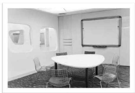
圖十三 學習諮詢室

推廣方面則透過舉辦活動吸引讀者來興閱坊，充分利用所有經過規劃設計的設施。如圖十六，我們舉辦比較夯的“「韓語俱樂部」第二外語學習課程”，吸引喜歡韓語的學生前來利用相關資源。也辦了“「資訊同好會」多媒體學習課程”，徵召同學來當指導員，教的與學的同受益處。另外，“「英語咖啡吧」英語會話課程”活動，老師在知識吧裡與學生進行英語會話的學習，得到很多學生的參與。