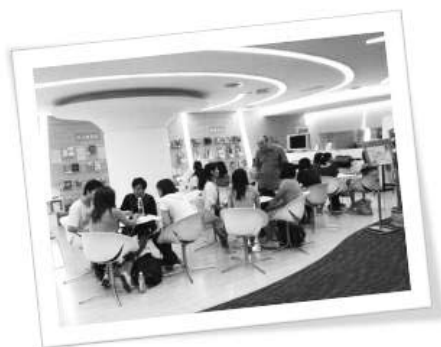
圖十六 推廣活動剪影一