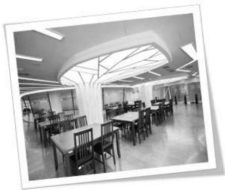
圖三 自習室樹幹延伸意象