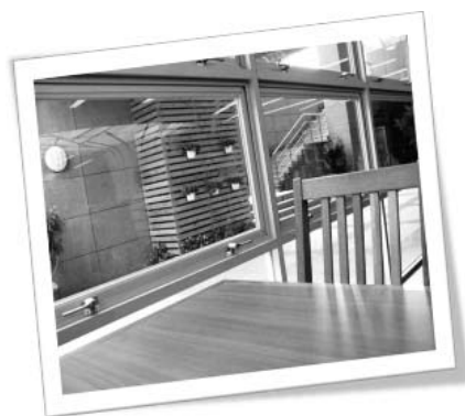
圖五 自習室席位窗位