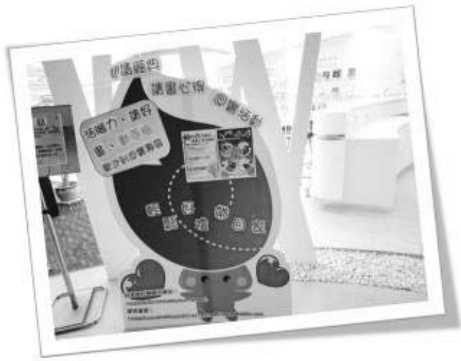
圖十七 推廣活動剪影二

還有如圖十七「書香、花香、咖啡香」世界閱讀日推廣活動」以及我們設計出來的興閱坊興寶寶。