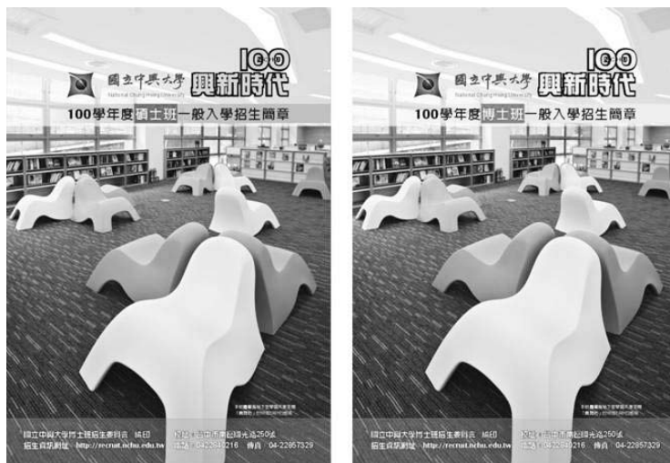
圖十八 中興大學招生簡章（照片為興閱坊悅讀區）

造更好的學習環境，是基於身為大學圖書館提供自由討論學習空間的使命。關於傳統自習空間不夠的問題，圖書館也沒有忽略此需求，在施工期間，週末延長開放總館一、二樓，將人潮引到總館，期中、期末考期間每日即開放總館一、二樓，另外也請廠商製作3D空間示意圖放在網路及進館入口，讓師生隨時了解工程進度。在