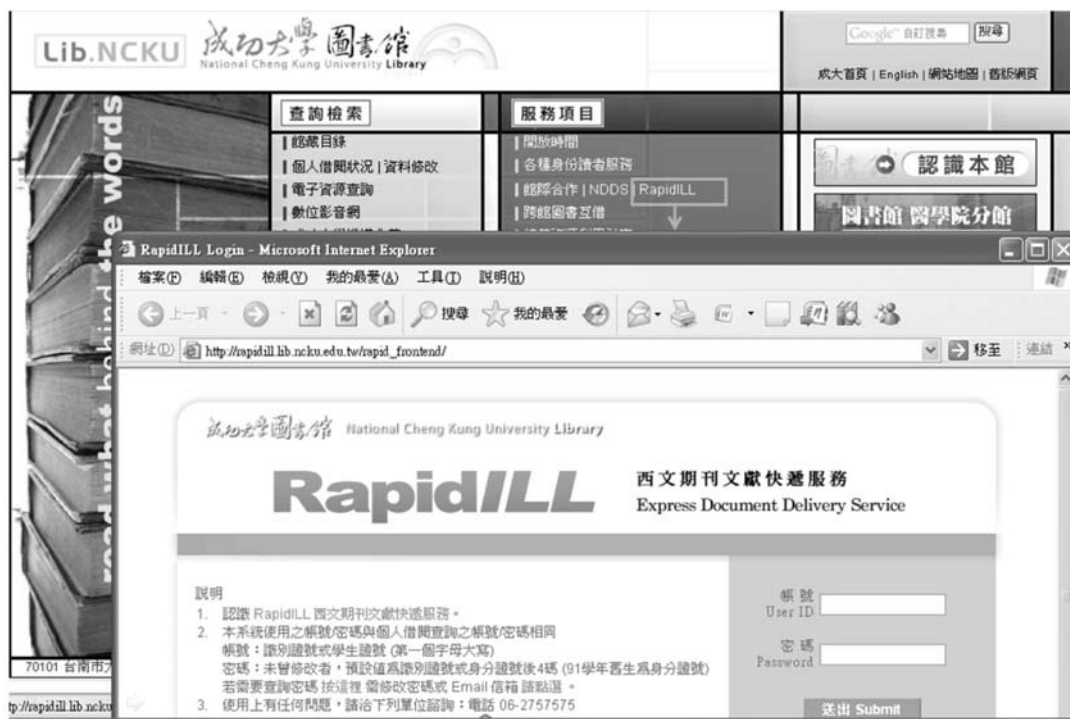
圖一 RapidILL西文期刊文獻快速服務登入畫面