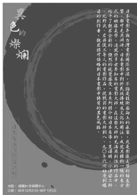
日本導演作品展海報 / 楊勝閔設計