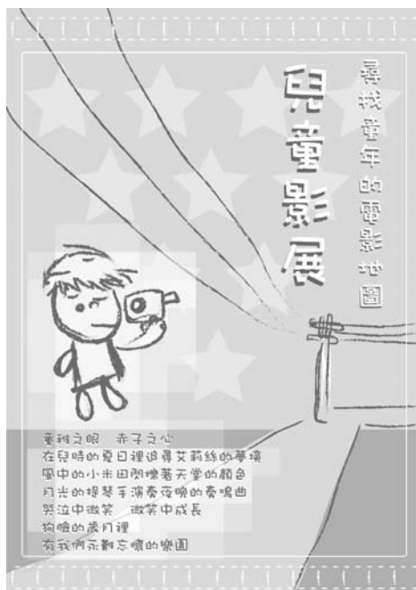
兒童影展海報 / 宋宜臻設計