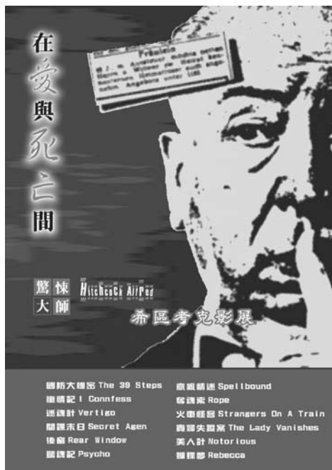
希區考克影展海報 / 吳幸璇設計