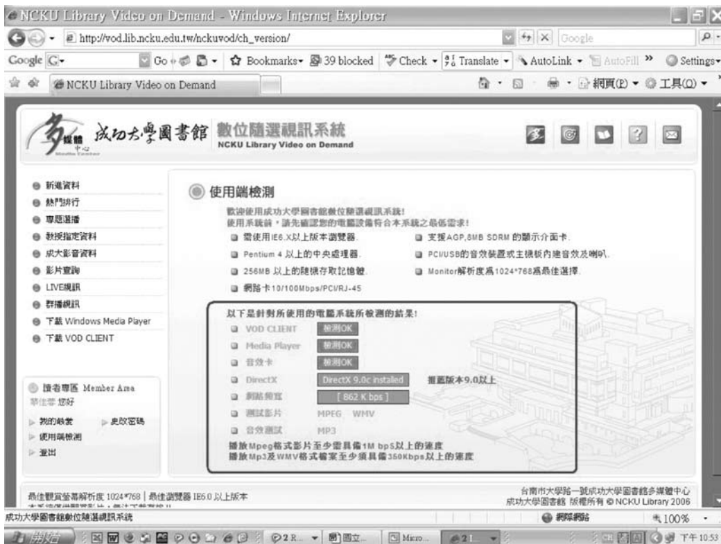
圖五 隨選視訊系統使用端檢測