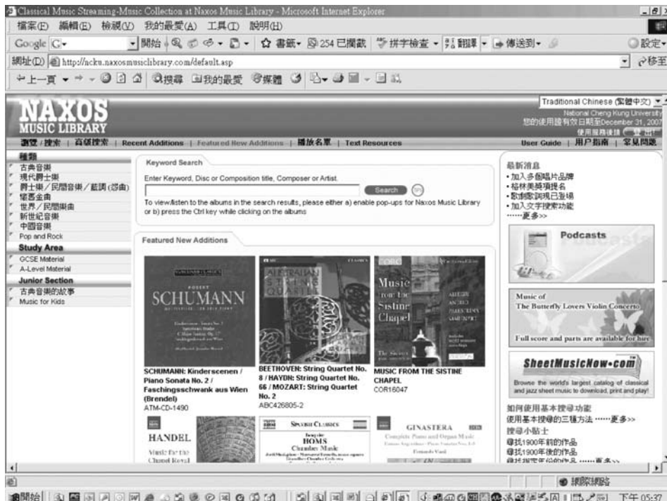
圖九 Naxos Music Library 中文使用介面

on Demand）鐳射唱片，約 23 萬多首樂曲，預計每月增加 500 張以上新專輯。該資料庫曲目齊備，包含「古典音樂」、「傳統爵士」、「現代爵士」、「懷舊金曲」、「怨曲」、「世界各地民謠」、「兒歌」、「新世紀」、「中國傳統音樂」、「鄉村」、「流行／搖滾」、「電影原聲」… 等從中古時期音樂到現代作曲家之作品。資料庫除提供隨選音樂外，更附有由音樂教授學者所撰寫的作曲家及曲目介紹，聆聽音樂同時亦可閱讀有關資料。