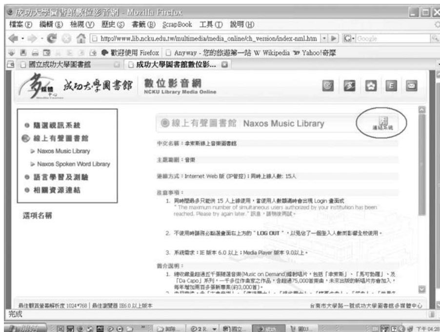
圖三 成功大學圖書館數位影音網資料庫連結之說明畫面