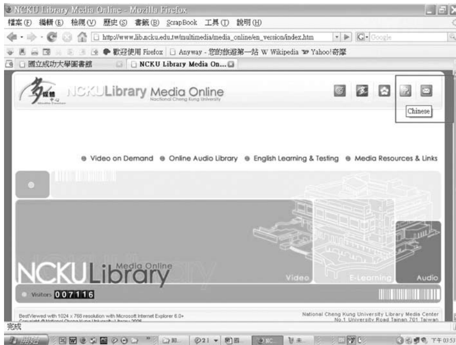
圖二 成功大學圖書館數位影音網英文版首頁