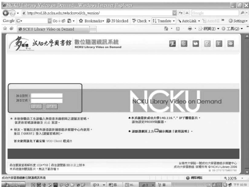
圖四 隨選視訊系統登入首頁