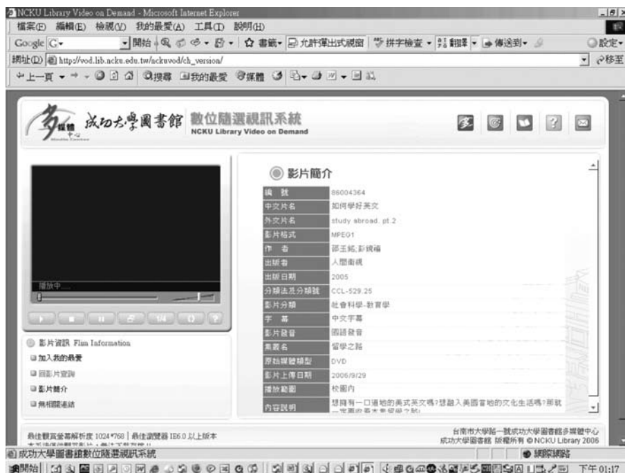
圖八 隨選視訊系統影片播放頁面