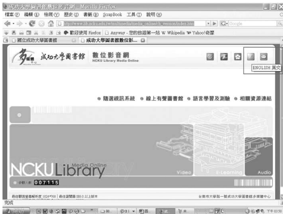
圖一 成功大學圖書館數位影音網中文版首頁

使用者除可透過此網站連結，使用圖書館提供之各影音資料庫外，亦可利用頁面上方所提供之圖示連結，回到本館或多媒體中心首頁，亦可點選「聯絡我們」郵件圖示，將使用意見或問題以電子郵件傳送給管理者。