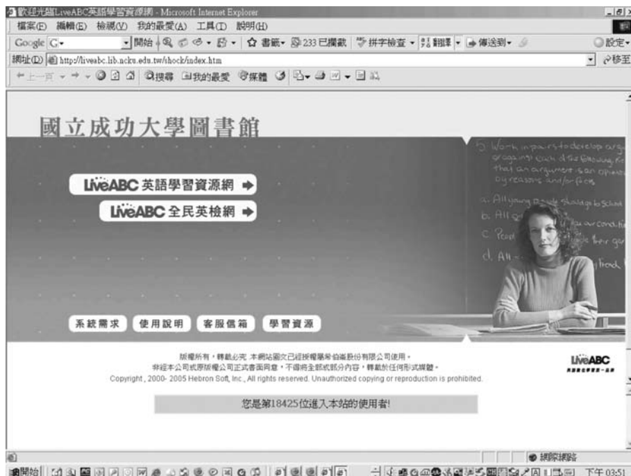
圖十三 LiveABC 全民英檢網、LiveABC 英語學習資源網首頁