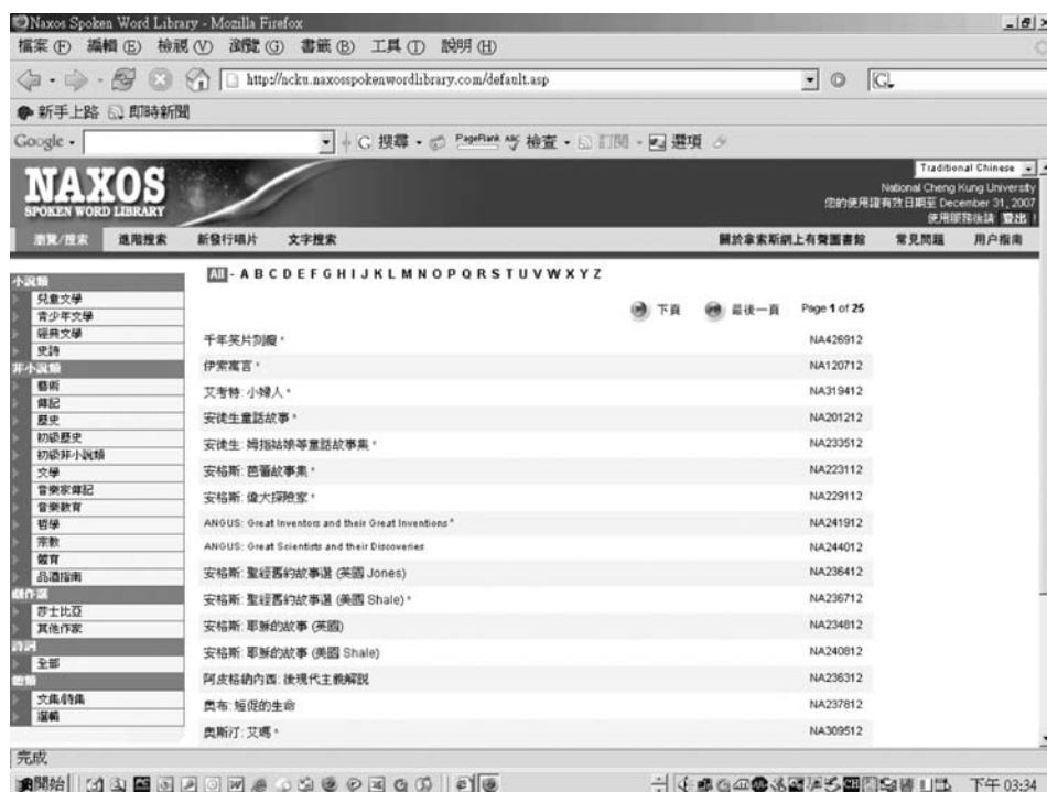
圖十 Naxos Spoken Word Library 中文使用介面

「少年經典著作」、「歷史」、「兒童歷史」、「莎士比亞戲劇」、「其他作家戲劇」、「詩詞集」、「散文集」、「偉人／名人傳記」、「哲學」、「宗教」、「體育」、「音樂家／作曲家傳記」、「音樂教育」、「藝術」、「美酒入門書」、「文學精選輯」等作品。該資料庫內之作品全由外籍演員、大學教授或知名廣播員，以純正英語或美語朗讀。部分有聲作品之全文及相關資料介紹，同步顯示於電腦螢幕上，可供列印，便於讀者對照文本閱讀。