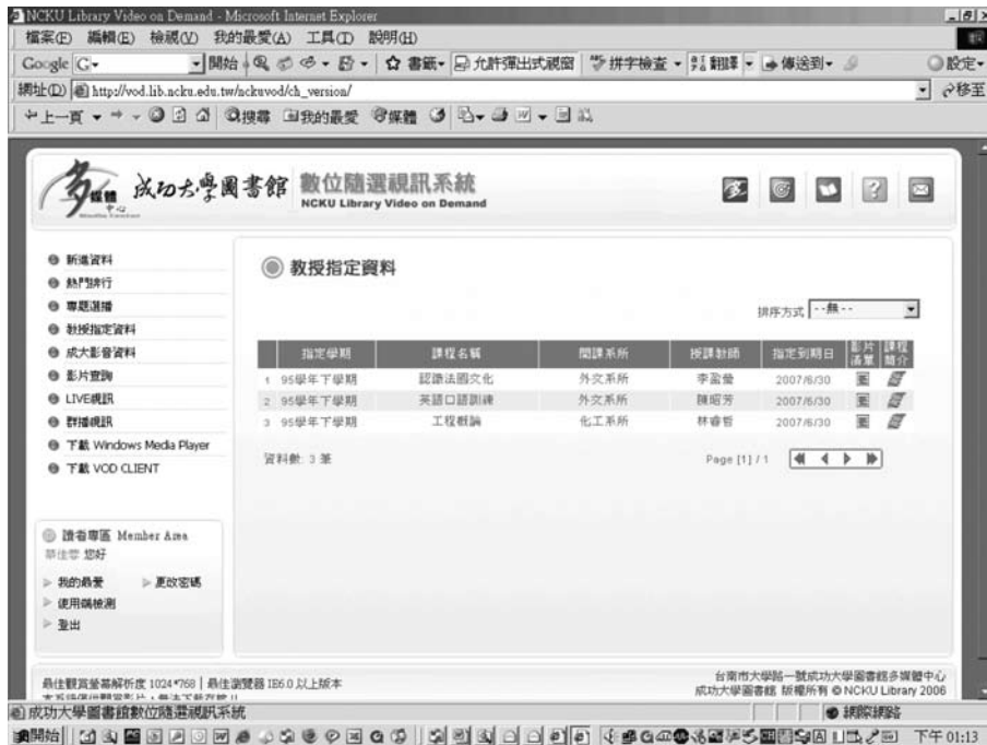
圖七 隨選視訊系統教授指定資料頁面