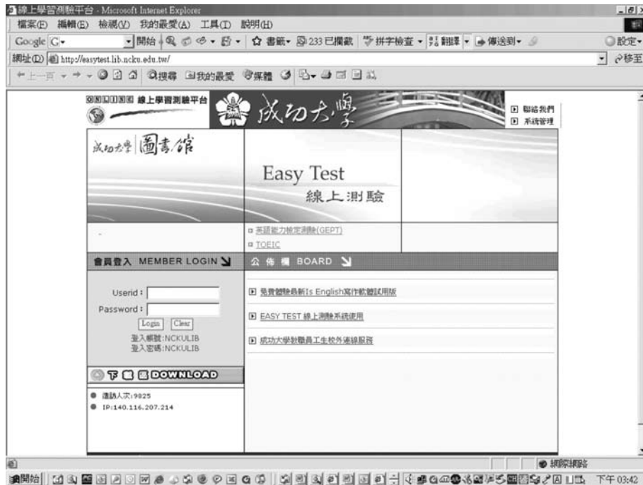
圖十二 EASY TEST 線上測驗系統