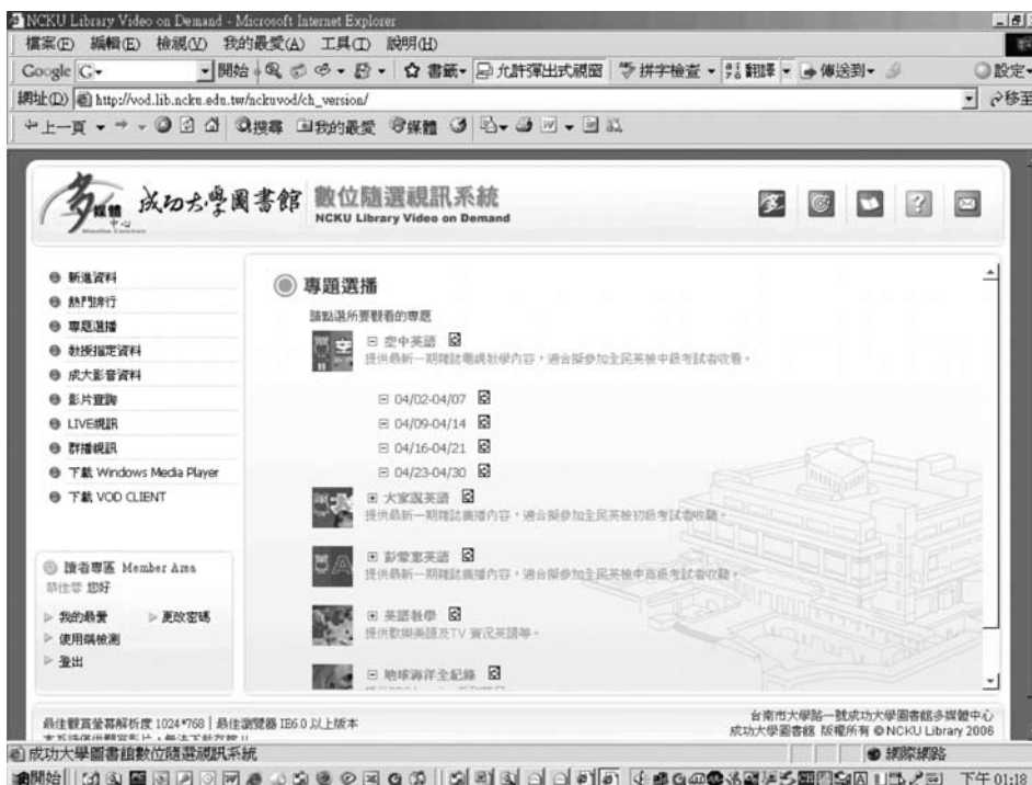
圖六 隨選視訊系統專題選播頁面